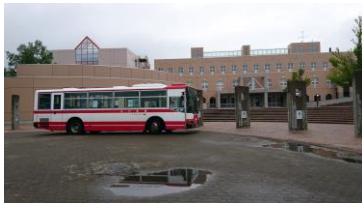
大会受付は奥に見える建物内